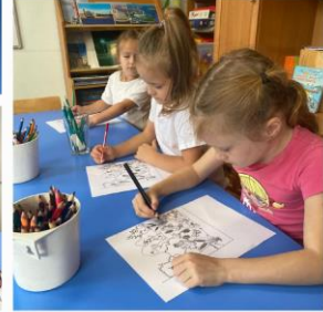
Воспитанники группы 8 сделали заготовки на зиму из овощей и нарисовали фруктовые натюрморты.