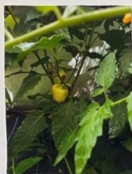
ЕШЬТЕ ПРЯМО С ГРЯДКИ -