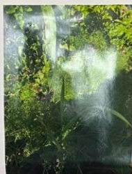
БУДЕТ ВСЁ В ПОРЯДКЕ