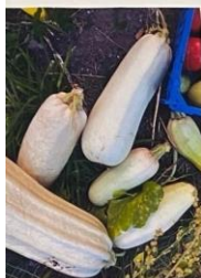
ТАКОЕ ОГОРОД - ИТАМИНОВ ХОРОША!