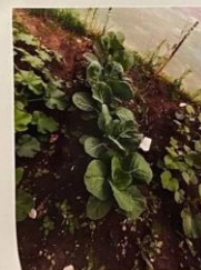
ДЛЯ САЛАТА - ПЕРЦЫ, ЛУК, ЛИШЬ БЫ НАМ ХВАТИЛО